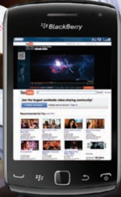
BlackBerry® Curve™ 9380